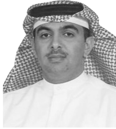
سعادة الشيخ سلمان بن عيسى آل خليفة نائب محافظ مصرف البحرين المركزي عضو مجلس الإدارة