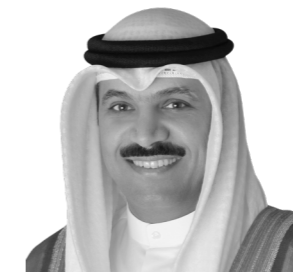
معالي الدكتور محمد بن يوسف الهاشل محافظ بنك الكويت المركزي عضو مجلس الإدارة