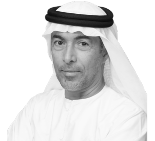
معالي خالد محمد بالعمي محافظ مصرف الإمارات العربية المتحدة المركزي عضو مجلس الإدارة