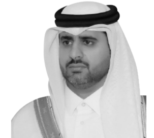
سعادة الشيخ بندر بن محمد بن سعود آل ثاني محافظ مصرف قطر المركزي عضو مجلس الإدارة